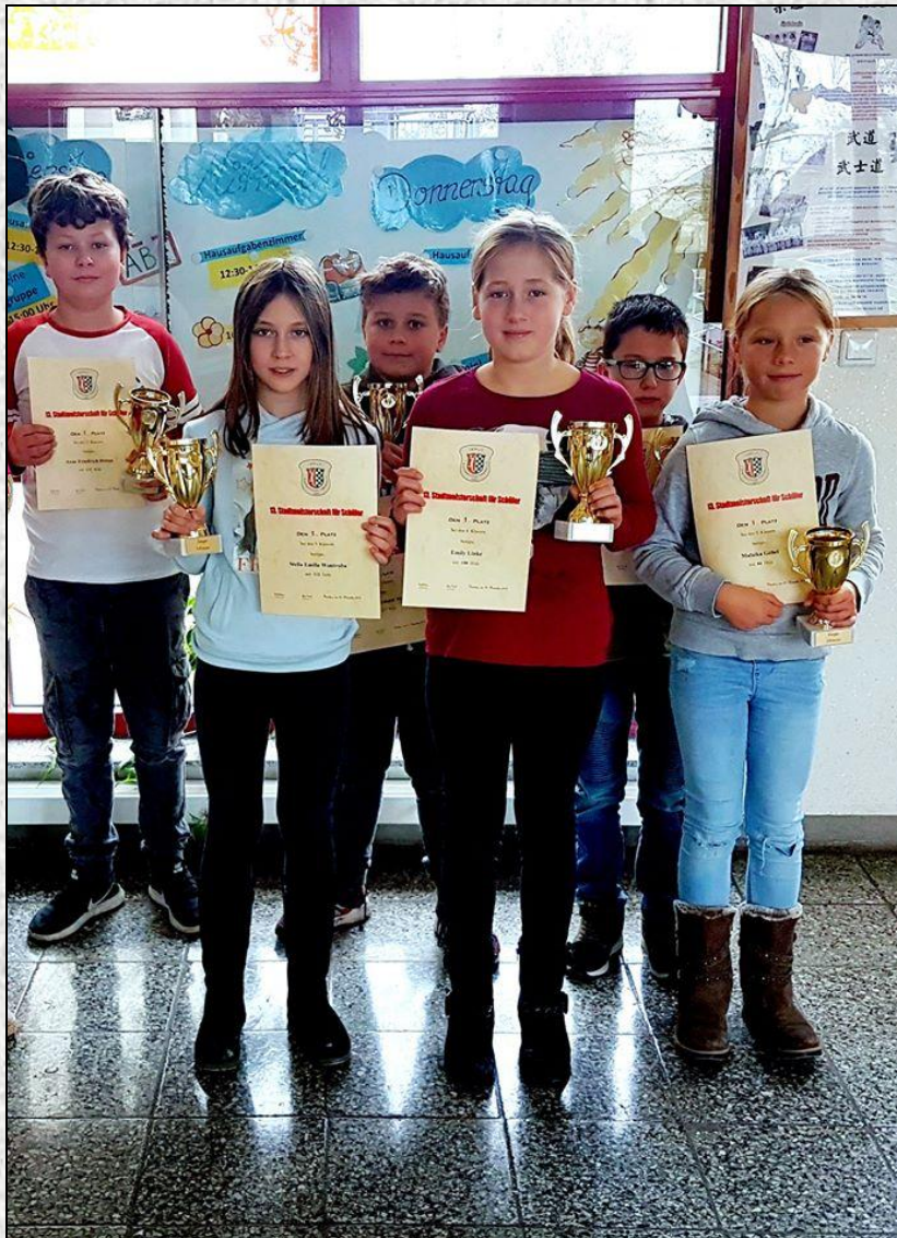
Sieger beim Vetschauer Schulmeisterschaften im Kegeln

Für Irrtümer und Druckfehler übernehmen wir keine Haftung! „Angaben ohne Gewähr“!