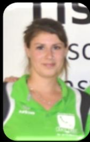
Foto - Königin des Tages