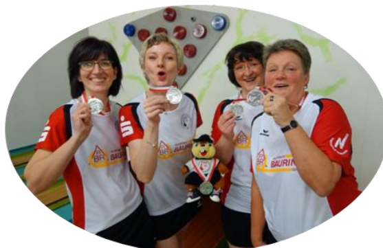
BBC 91 Neuruppin Vize Landesmeister (Archiv)